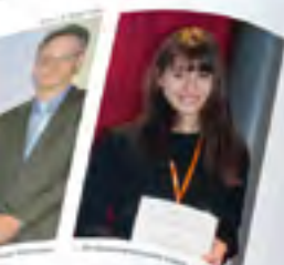
...den Schweizer Regionalkongress